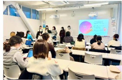
2023年の『社会連携を学ぶ』授業の様子

明治の広報部メンバーが外部ゲストとして参加した2021年度、2022年度のJWU社会連携科目「社会連携を学ぶB」での授業において、社会課題の解決を目指す新たな食育活動として「大学生にとっての食を通じたケア」を明治に提案したことがチーム発足のきっかけとなりました。